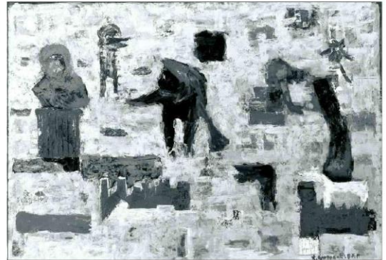
СЛИКА Реликвије, 1987.

Од 1967. па до смрти, Црнчевић (Дупило, 1941- Београд, 2013) се уз вајарство, бавио и графиком и сликарством. Радове је представио на више од 20 самосталних изложби у земљи и иностранству, а данас се његова дела,