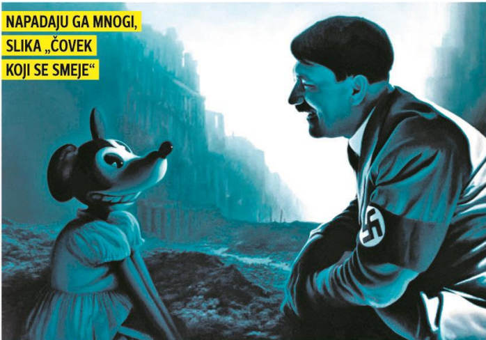
NAPADAJU GA MNOGI, SLIKA „ČOVEK KOJI SE SMEJE“