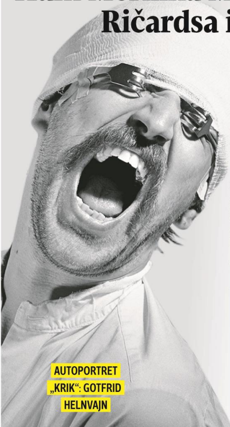
AUTOPORTRET „KRIK“: GOTFRID HELNVAJN

na nacizma. Mislim da je to ostavilo veoma veliki utisak na ljude, osećali su neku vrstu odgovornosti. Međutim, verovatno neki neonacisti, isekli su preko noći grkljane na nekim slikama, što je takode interesantno, pa sam zakrpio te rezove i ostavio slike da se vide, kao da je i to deo umetnosti - navodi Helnvaajn. ■