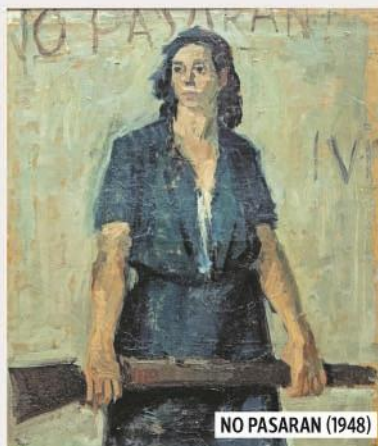
NO PASARAN (1948)