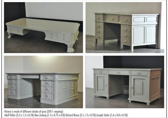
History is made of different shades of grey (2011-ongoing) Adolf Hitler (3.5 x 1.5 x 0.78) Mao Zedong (1.5 x 0.75 x 0.8) Richard Nixon (2 x 1.5 x 0.78) Joseph Stalin (1.6 x 0.8 x 0.78)

Van Brakov najrecentniji rad - Titov radni sto - koji je takođe zasnovan na višegodišnjem istraživanju u Beogradu biće izlo-