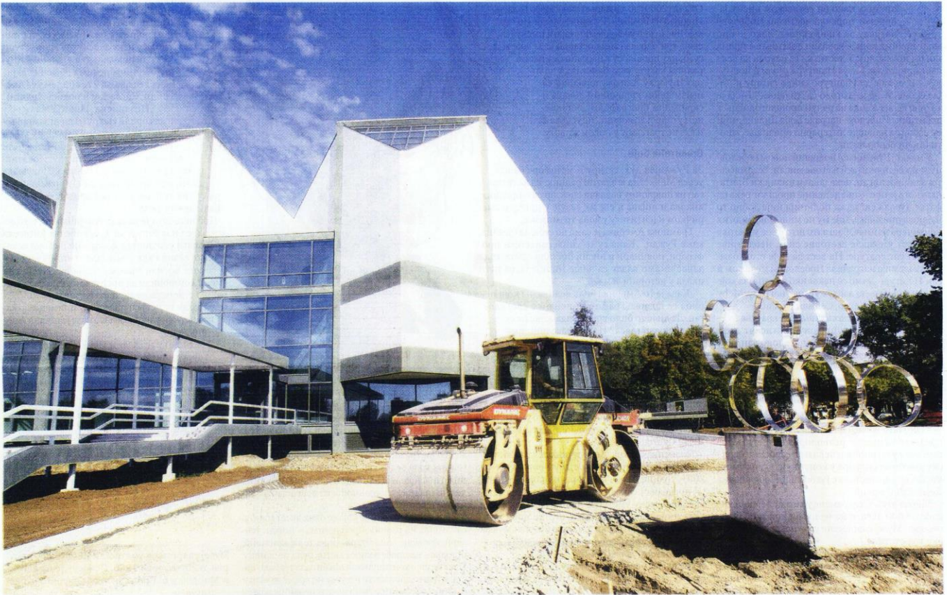
Окупана фасада Музеја савремене уметности у Београду: у збирци више од 8000 дела

Музеј савремене уметности, зграда на београдском Ушћу, биће отворен у петак 20. октобра од 10 часова, непрекидно 24 сата наредних седам дана. Отварање ће протекти без икакве званичне церемоније и говора. Врата музеја једноставно ће се отворити за посетиоце који десет година колико је трајала реконструкција музеја нису ушли у зграду на Ушћу.