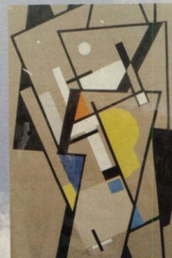
Едуард Степанчић „Колаж“ (око 1930.), оловка, разблажени туш и колаж на папиру