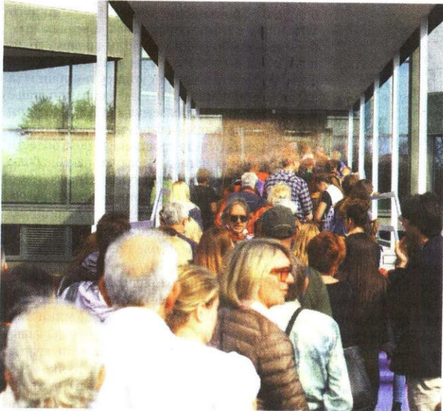
Ред на улазним степеницама