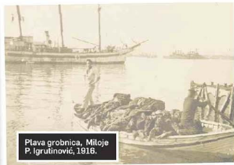
Plava grobnica, Miloje P. Igrutinović, 1916.