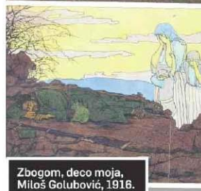
Zbogom, deco moja, Miloš Golubović, 1916.

blokove i slikali za svoju dušu. A u tom periodu užasa, između velikih bitki, nastala su najznačajnija dela srpskog impresionizma.