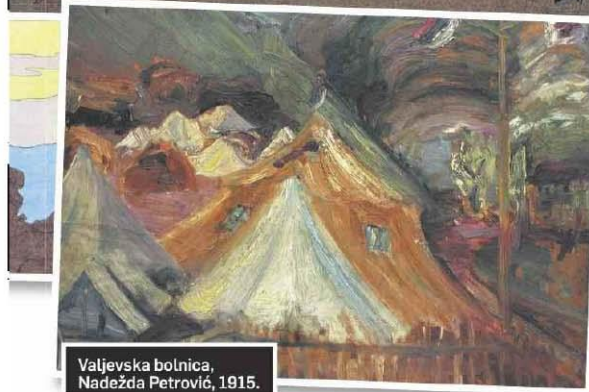
Valjevska bolnica, Nadežda Petrović, 1915.

obuhvata dela Nadežde Petrović, Koste Miličevića, Mališe Glišića, Milana Milovanovića, Miloša Golubovića, Vladimira